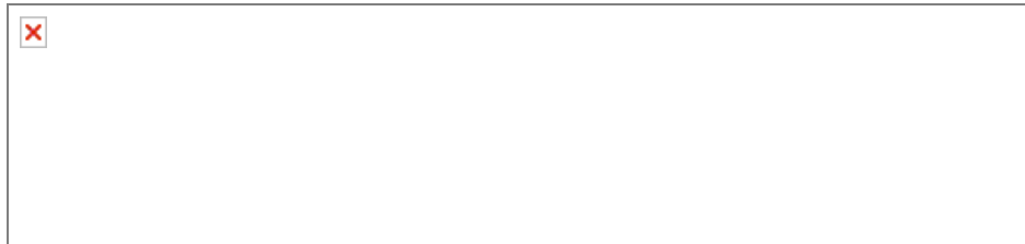
Figura 1: Estructura general del método Prim@

Las figuras 1 a 3 muestran, de una manera gráfica, la estructura de este método: